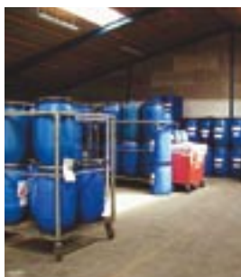
Uniscrap løser affaldsopgaver for alle brancher