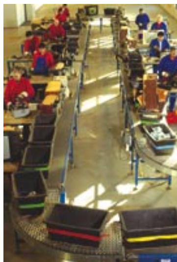
Uniscrap har stor erfaring og ekspertise i håndteringen af elektronikaffald

Uniscrap A/S er en danskejet affalds- og genvindings-koncern, der i 2002 er skabt gennem fusion af Dansk Genvinding A/S, Uniscrap Genvindingsindustri A/S og Dansk Flaskegenbrug A/S. Uniscrap har som erklæret mål at fremstå som en mønstervirksomhed både inden for og uden for miljøbranchen.