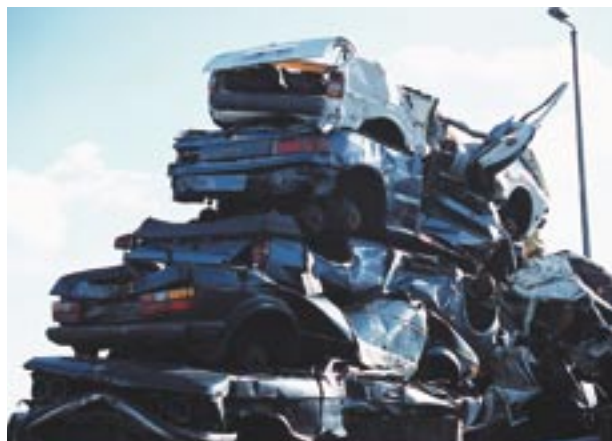
Efter en gennemgribende miljøbehandling af skrotbiler presses metaldelene i store shredder anlæg

På vores hjemmeside findes aktuelle oplysninger om kvalitetssortering, modtagevilkår og andre forhold, der vedrører Uniscraps modtagelse, afregning og genanvendelse af affald.