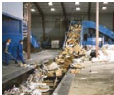
Uniscraps samlede papiranlæg håndterer nemt 200 tons om dagen