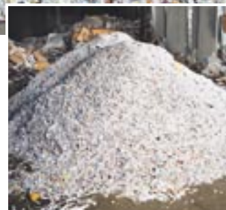
Fortrolige papirer makuleres efter procedure iht. aftale med den enkelte kunde

Uniscrap A/S er en danskejet affalds- og genvindingskoncern, der i 2002 er skabt gennem fusion af Dansk Genvinding A/S, Uniscrap Genvindingsindustri A/S og Dansk Flaskegenbrug A/S. Uniscrap har som erklæret mål at fremstå som en mønstervirksomhed både inden for og uden for miljøbranchen.