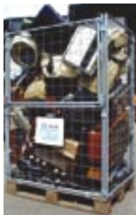
EE affald er et voksende forretningsområde