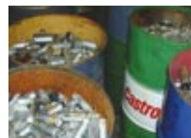
Uniscrap foretager sikkerhedsdestruktion af datamedier samt udtagning af miljøfarlige komponenter fra apparater og maskiner