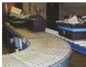
Sikker miljøbehandling af elektroniske og elektriske produkter kræver en betydelig manpower i alle led